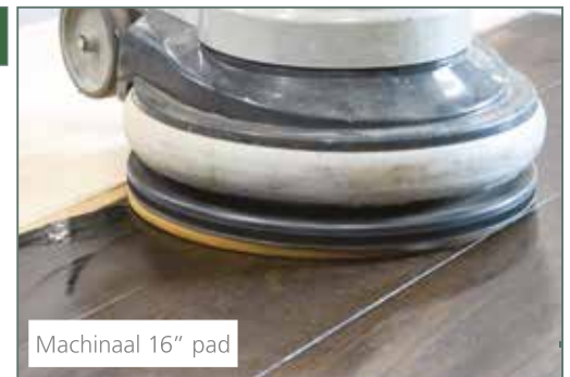
Machinaal 16" pad