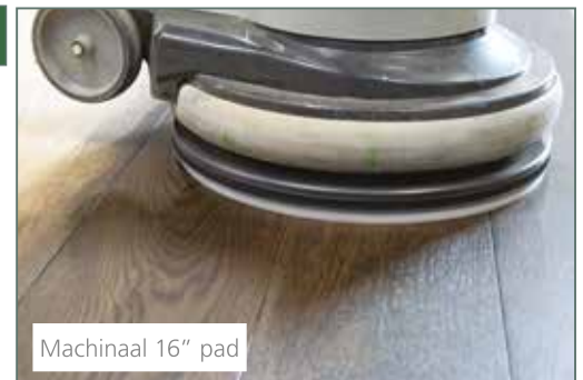
Machinaal 16" pad